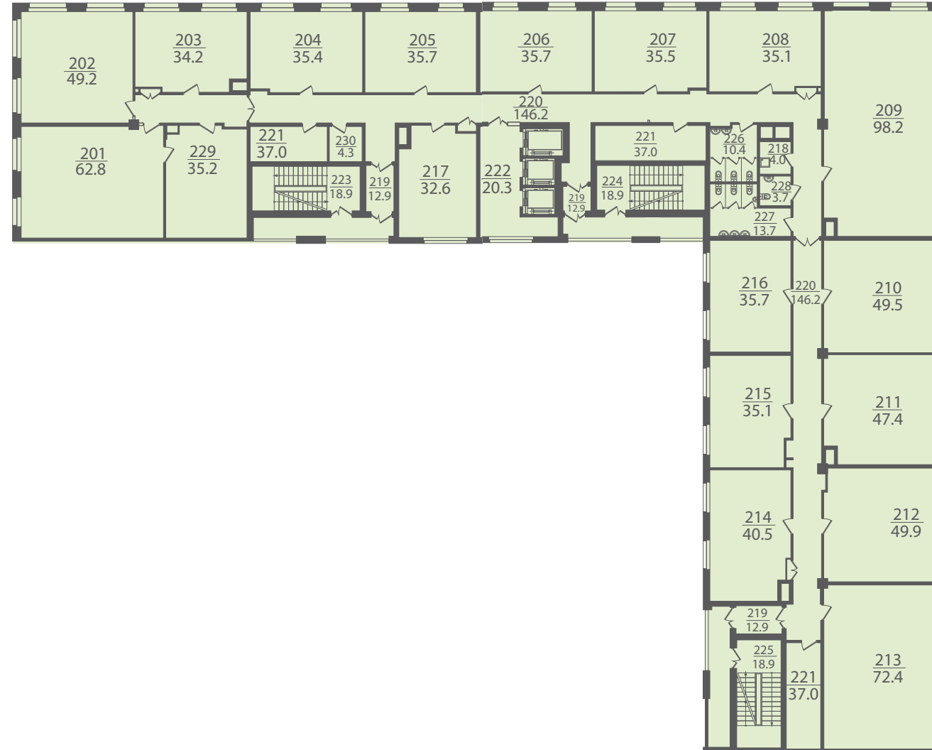
Типовой этаж (2-7)